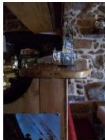
Borne d'accueil (photo n°8 et 9)