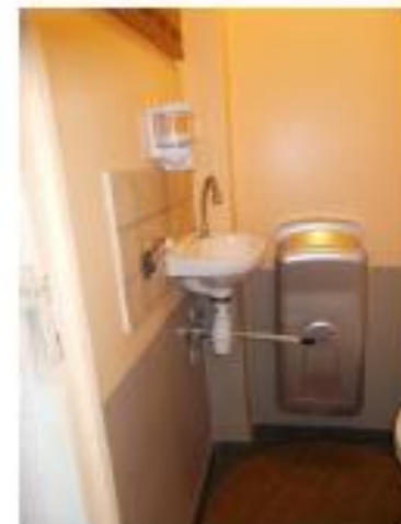
Sanitaires (photo n°10, 11, 12 et 13)